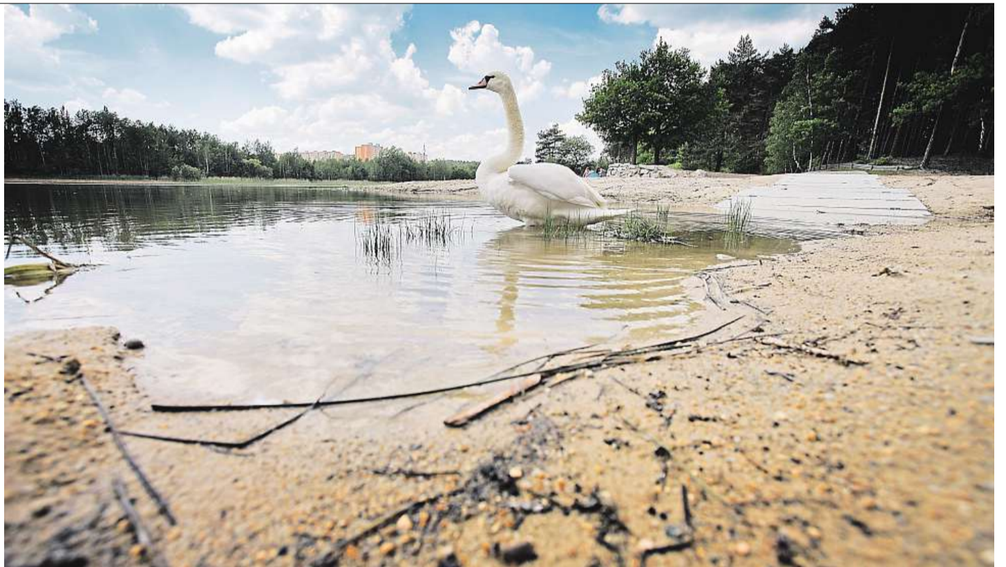
Málo vody Po revitalizaci se kvůli malému stavu vody nedaří znovu napustit Senečský rybník v Plzni.