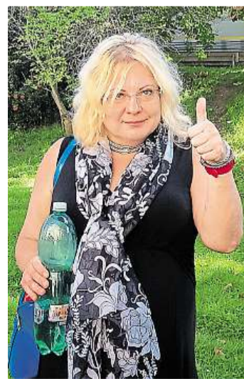
Eva Š. Verdikt soudu přivítala. „Jsem alkoholička,“ přiznala.

„Umírala mi kamarádka,“ vysvětlovala tehdy, proč sáhla po láhvi bourbonu. Incident z února 2015 nicméně nebyl poslední. I potom byla v ordinaci v podroušeném stavu, až jí soud loni předběžným opatřením zaká-